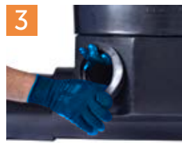
Colocación de empaques