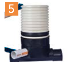
Colocación del elevador