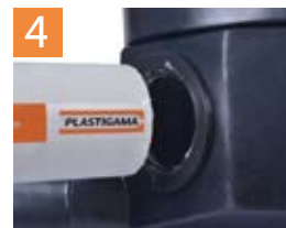
Conexión de las Tuberías