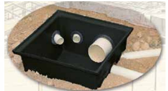
CAJA DOMICILIARIA PLASTIGAMA Proyecto Habitacional Mucho Lote