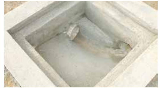
CAJA DOMICILIARIA De hormigón hecho en sitio.

Además, por su bajo peso son muy livianos y fáciles de instalar. Siempre adaptables a la necesidad de la obra.