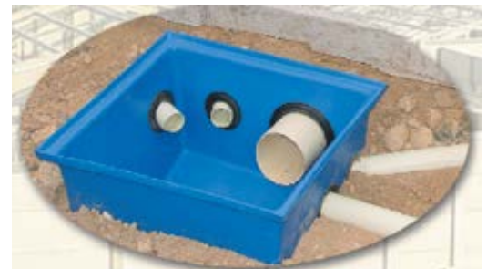
CAJA DOMICILIARIA PLASTIGAMA Proyecto Habitacional Mucho Lote