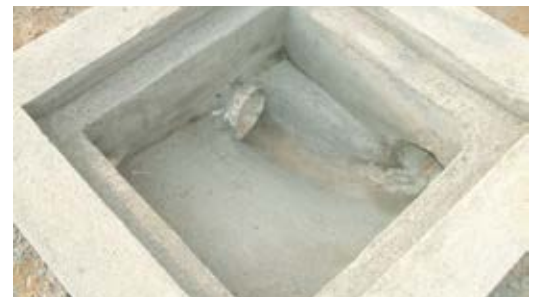
CAJA DOMICILIARIA De hormigón hecho en sitio.

Además, por su bajo peso son muy livianos y fáciles de instalar. Siempre adaptables a la necesidad de la obra.