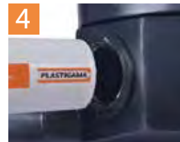
Conexión de las Tuberías