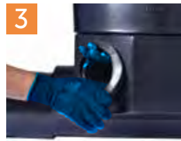
Colocación de empaques