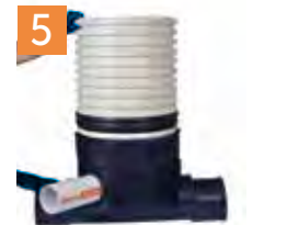
Colocación del elevador