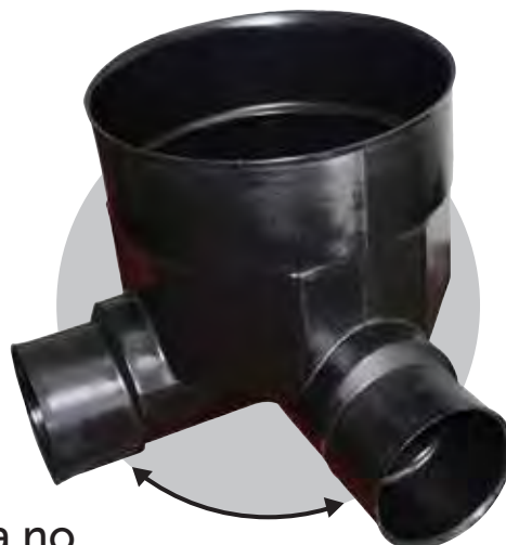
Caja no alineada 90°