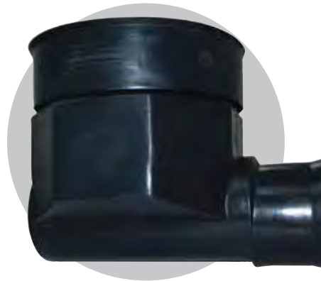
Caja Ciega (De arranque)