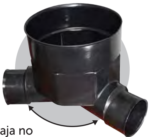
Caja no alineada 135°